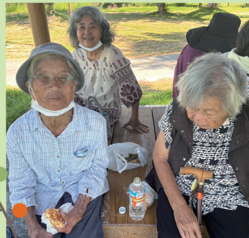
サンドイッチ美味しいさ～