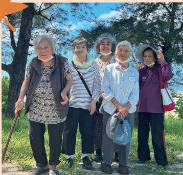
運動の秋もいいね～