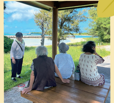
風がきもちいいね～